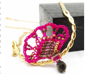
Collier Victoria - Aux pays des merveilles

Notre attention se porte particulièrement sur la collection "Au pays des merveilles", il s'agit d'une collection "premium", où les éléments en métal sont réalisés par les soins de la créatrice et doré chez un professionnel de la dorure à 3 microns. Une combinaison d'un travail de bijouterie et de crochet, rendant le bijou encore plus unique.